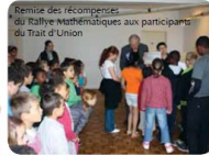
Remise des récompenses du Rallye Mathématiques aux participants du Trait d'Union.

Une petite cérémonie a été organisée en Mairie le 2 juillet pour la remise de récompenses aux élèves du Trait d'Union, suite à un Rallye Mathématiques au cours duquel ils se sont distingués. Cette fin d'année scolaire a pris un air de fête !