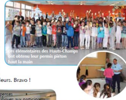
Les élémentaires des Hauts-Champs ont obtenu leur permis piéton hier la matinée.

Le 1 er juillet, des gendarmes ont délivré les Permis Piétons aux CM1/CM2 de l'école des Hauts-Champs. Avec une moyenne générale de 10/12, nos écoliers se sont classés parmi les meilleurs. Bravo !